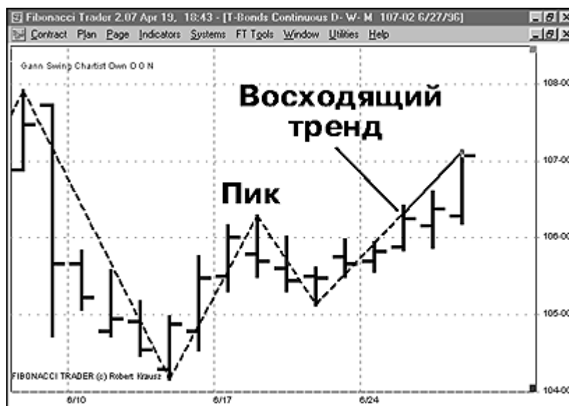
Рис. 5. Тренд изменяется вверх после прохождения пика

ВОСХОДЯЩИЙ ТРЕНД: изменение тренда снизу вверх (UPTREND: Trend change from Down to Up). Первое, пунктир отражает нисходящий тренд. Сплошная линия отражает восходящий тренд. Чтобы измениться с нисходящего тренда на восходящий, тренд должен сначала идти вниз, как показано пунктирной линией. Пик образуется восходящим переломом, вслед за которым развивается нисходящий перелом. Если этот пик происходит на верхней стороне, то тренд изменится с нисходящего на восходящий. Фибоначчи Трейдер автоматически изменяет Линию Перелома Ганна на сплошную линию зеленого цвета после того, как сформируется пик. Рынку не обязательно закрыться над пиком, чтобы изменить тренд вверх.