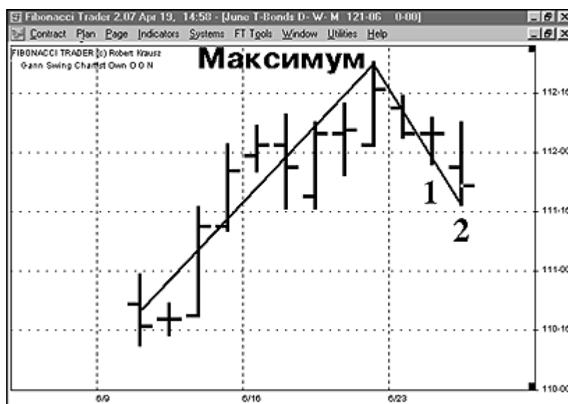
Рис. 4. Нисходящий перелом начинается после образования второго последовательного минимума, ниже предыдущего

ВОСХОДЯЩИЙ ТРЕНД: изменение тренда снизу вверх (UPTREND: Trend change from Down to Up). Первое, пунктир отражает нисходящий тренд. Сплошная линия отражает восходящий тренд. Чтобы измениться с нисходящего тренда на восходящий, тренд должен сначала идти вниз, как показано пунктирной линией. Пик образуется восходящим переломом, вслед за которым развивается нисходящий перелом. Если этот пик происходит на верхней стороне, то тренд изменится с нисходящего на восходящий. Фибоначчи Трейдер автоматически изменяет Линию Перелома Ганна на сплошную линию зеленого цвета после того, как сформируется пик. Рынку не обязательно закрыться над пиком, чтобы изменить тренд вверх.