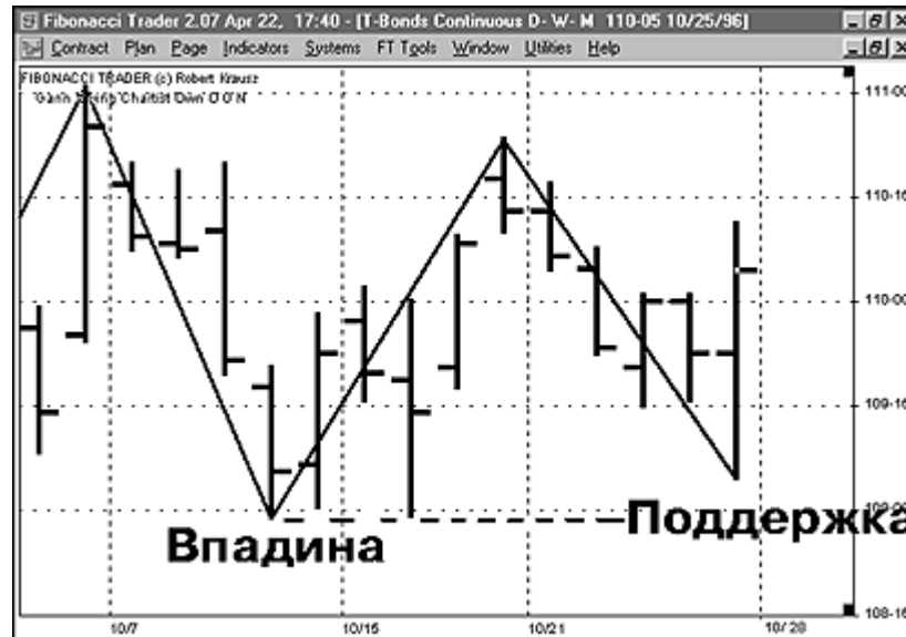
Рис. 7. Четко определенная впадина будет действовать как поддержка. Пока рынок не опускается ниже впадины, поддержка остается действовать

ПОДДЕРЖКА: поддержка – это впадина предыдущего четко определенного перелома. Пока цены не проникают ниже точки впадины, поддержка считается все еще действующей и продолжает оказывать влияние. Эта точка впадины на самом деле является минимумом предыдущего законченного нисходящего перелома, вслед за которым последовал восходящий перелом. Если цены проникают ниже этой впадины, тогда поддержка может оказаться неудавшейся. Уровень поддержки или впадины может появиться когда рынок находится и в восходящем, и в нисходящем тренде.