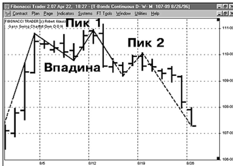
Рис. 10. Падающие пики могут обозначать достижение вершины