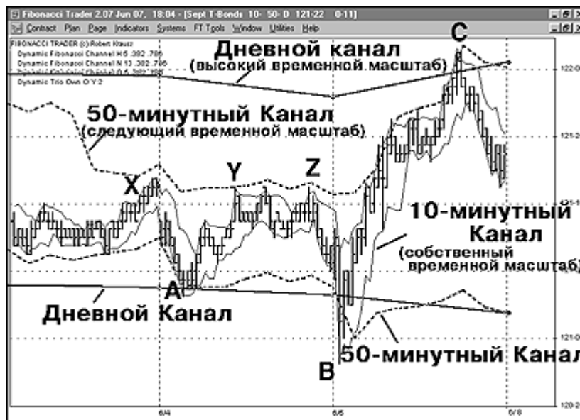
Рис. 12. Казначейские бонды, 10-минутные бары. Обратите внимание, как рынок разворачивался на границах Динамических Каналов Фибоначчи в точках «А», «В» и «С». Точки «А» и «В» являются потенциальными настройками на покупку, в то время как точка «С» относится к вероятной настройке на продажу. Следует заметить, что Следующий временной масштаб (50-минутный в данном случае) останавливает цены, что здесь хорошо видно в таких точках как «X», «Y» и «Z».

Только что представленный пример – для Высокого Временного Периода, Следуйте по той же схеме для Следующего Временного Периода, чтобы убедиться, что показаны только линии вершины и основания этого канала. Третий канал, который мы изображаем, предназначен для Собственного Временного Периода (10 минут). Это - наш основной для анализа бар, то есть, временной масштаб, в котором мы на самом деле ведем торговлю. Последняя настройка будет выглядеть подобно тому, как это представлено на Рисунке 12.