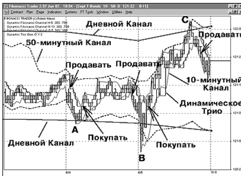
Рис. 14: Казначейские бонды, 10-минутные бары. Испытания поддержки и сопротивления в Динамических Каналах может сочетаться с Динамическим Трио для торговли. И поразмышляйте на досуге. Можете ли вы использовать эту концепцию для Дневных графиков? А как насчет попытки работать с дневными/недельными/месячными Динамическими Фибоначчи Каналами?