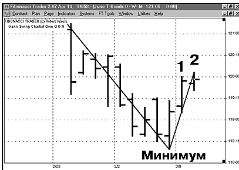
Рис. 3. Восходящий перелом начинается после образования второго максимума, последовательно превышающий предыдущую вершину

Восходящий перелом: снизу вверх (Upswing: from Down to Up). Первое определение охватывает восходящий перелом. Направление движения может измениться кверху только в том случае, если рынок образует два следующих друг за другом максимума. Если посмотреть на Рисунок 3, то можно увидеть, что максимум бара под номером 1 является первым последовательным максимумом, а бар номер 2 – вторым последовательным максимумом. Расположение минимумов не учитывается. Фибоначчи Трейдер автоматически проводит линию, отражающую восходящее колебание. Когда бы ни образовывался последовательный максимум, Фибоначчи Трейдер проводит белую линию. Крайние дни и другие тонкие вопросы данного подхода будут рассматриваться во втором выпуске.