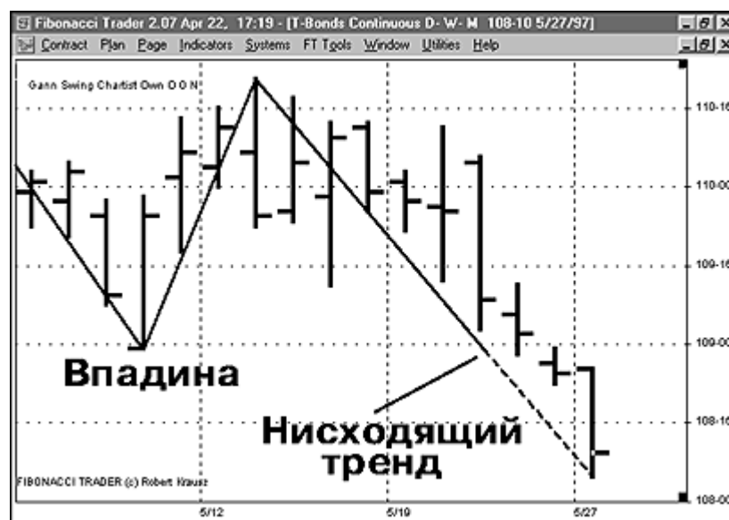
Рис. 6. Тренд изменяется книзу, когда цены идут ниже предыдущей впадины, а прежде тренд был направлен вверх

ПОДДЕРЖКА: поддержка – это впадина предыдущего четко определенного перелома. Пока цены не проникают ниже точки впадины, поддержка считается все еще действующей и продолжает оказывать влияние. Эта точка впадины на самом деле является минимумом предыдущего законченного нисходящего перелома, вслед за которым последовал восходящий перелом. Если цены проникают ниже этой впадины, тогда поддержка может оказаться неудавшейся. Уровень поддержки или впадины может появиться когда рынок находится и в восходящем, и в нисходящем тренде.