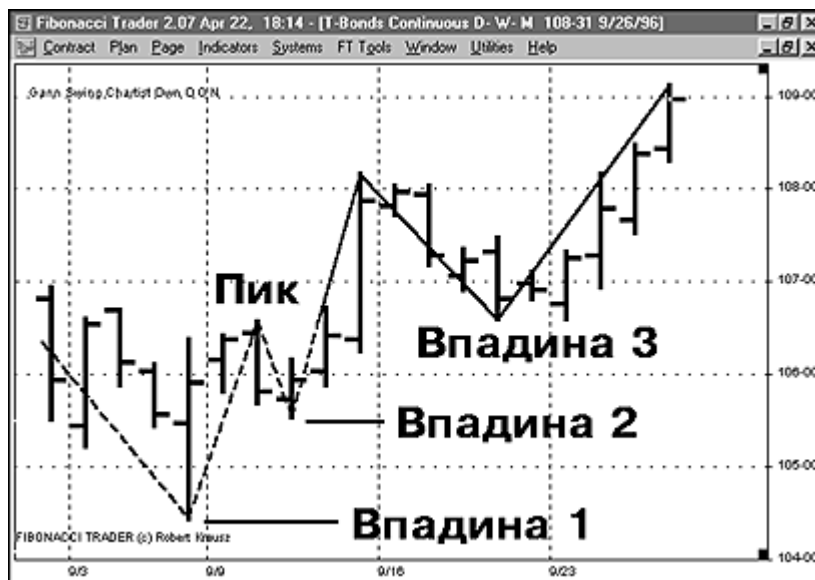
Рис. 9. Поднимающиеся впадины могут обозначать начало восходящего тренда

Поднимающиеся впадины: восходящий тренд определяется рядом поднимающихся впадин. Обратите внимание на Рисунке 9, что первая впадина заключает в себе низкое нисходящее колебание. Дальше рынок поднимался и образовал пик. Затем создалась впадина 2, которая выше впадины 1. В конце концов, рынок продвинулся выше пика, тем самым, сигнализируя об изменении с нисходящего тренда на восходящий. Интересно, что впадина 3 стала повторным испытанием последнего пика (бывшее сопротивление). Это – классический технический анализ в действии.