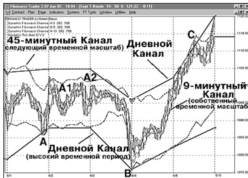
Рис. 13. S&P 500, 9-минутные бары. Случается, что не хватает энергии для проталкивания цен на всем пути к Высокому (Дневному) Каналу, и он останавливается Каналом Следующего Временного Периода, в данном случае 45-минутной верхней полосой в точках «А1» и «А2».

Ваш график для S&P 500 должен показывать все три канала, как на Рисунке 13. Лучше всего сохранить эти настройки в Системах (Systems), с тем, чтобы у вас не возникало нужды определять каждый раз настройки.