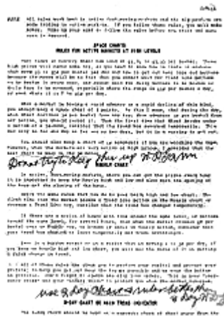
Рис. 1. Оригинал рукописи Ганна был изменен и подписан Ганном его характерными фиолетовыми чернилами

Некоторые из вас, возможно, знают, что Джо Рондинон был последним трейдером, обучавшимся у Ганна. Вы можете себе представить мой восторг, когда Рондинон спросил меня о том, заинтересован ли я в нескольких оригинальных курсах Ганна, которые он приобрел у Ганна аж в 1955 году. Рондинон объяснил, что курсы напечатаны на типографских бланках В. Д. Ганна не совсем обычного формата. Они были подписаны и датированы Ганном фиолетовыми чернилами.