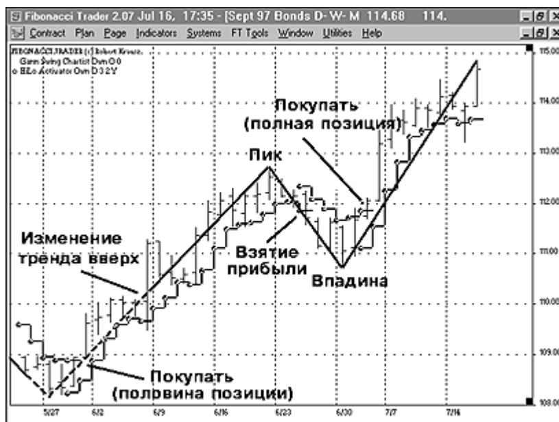
Рис. 2. Фибоначчи Трейдер автоматически изображает ключевые индикаторы (Из последующих четырех выпусков Журнала Фибоначчи Трейдер вы узнаете правила торговли Новых Построений Переломов Ганна)