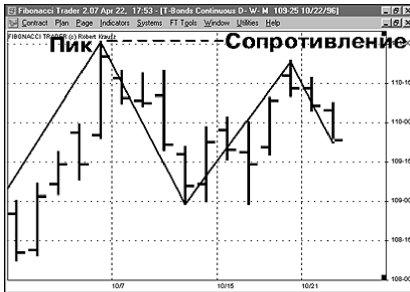
Рис. 8. Последний пик будет сопротивлением

Поднимающиеся впадины: восходящий тренд определяется рядом поднимающихся впадин. Обратите внимание на Рисунке 9, что первая впадина заключает в себе низкое нисходящее колебание. Дальше рынок поднимался и образовал пик. Затем создалась впадина 2, которая выше впадины 1. В конце концов, рынок продвинулся выше пика, тем самым, сигнализируя об изменении с нисходящего тренда на восходящий. Интересно, что впадина 3 стала повторным испытанием последнего пика (бывшее сопротивление). Это – классический технический анализ в действии.